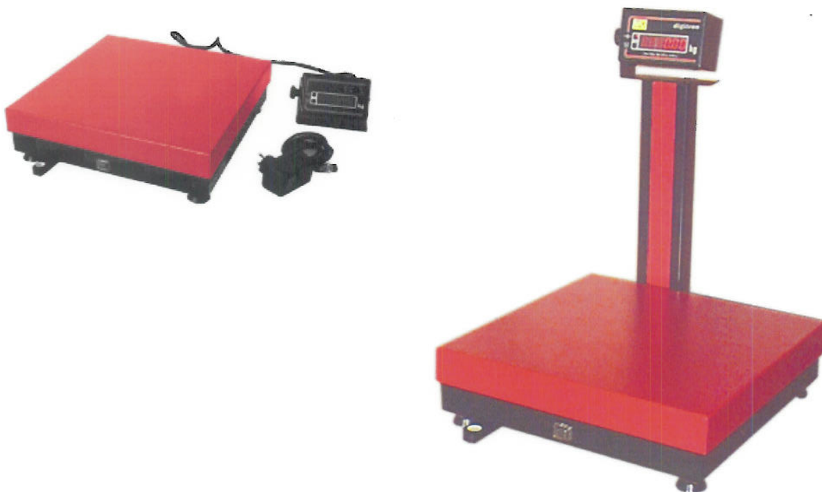
Izvedba vage diSKALA MA 40 s odvojenim pokazivačem i pokazivačem na stupu vage.