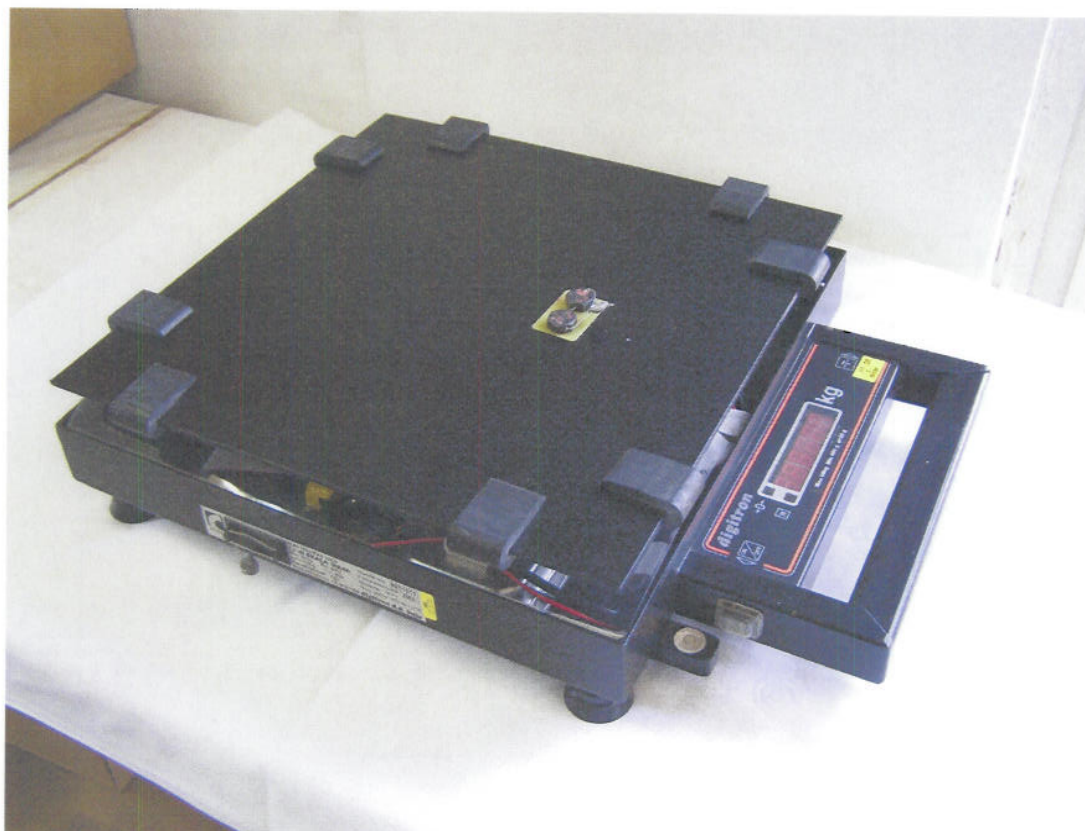
Zaštita vage diSKALA MA 40.