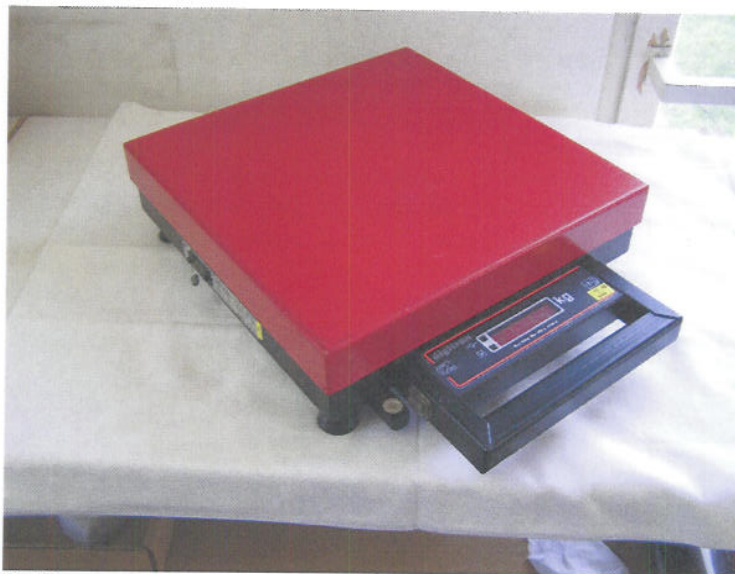
Izgled vage diSKALA MA 40.